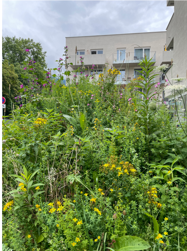
// Abbildung 1 „Zwischen Licht und Dunkelheit“, Detailansicht Hügel